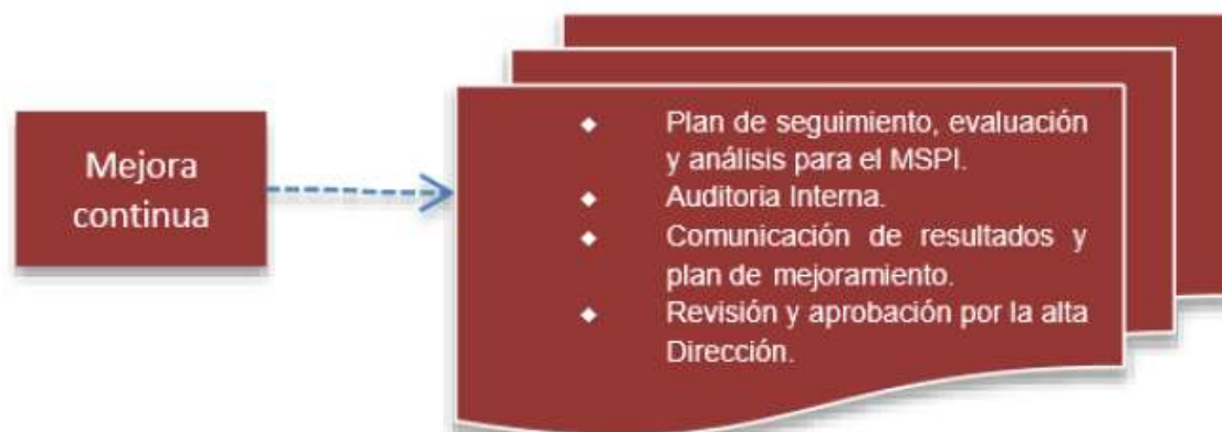
Figura 6: Fase Mejora Continua Modelo de Seguridad