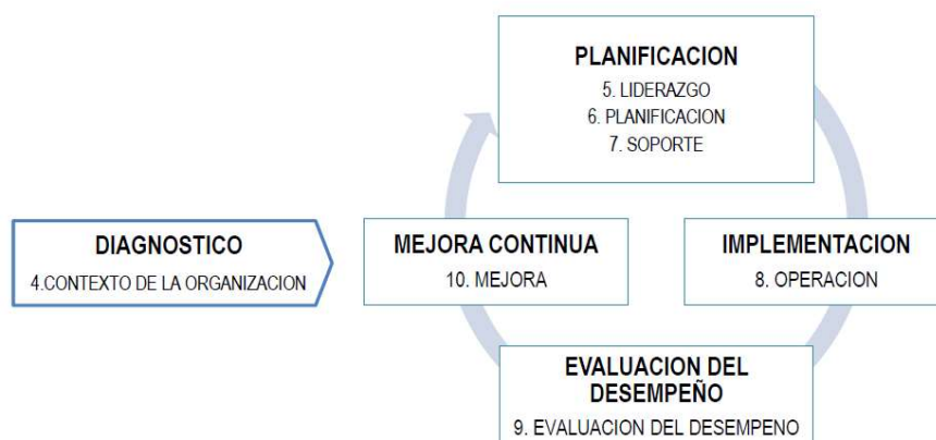
Figura 2: Norma ISO 27001:2022 alineada a la mejora continua