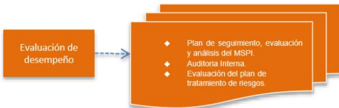
Figura 5: Fase Evaluación de Desempeño Modelo de Seguridad