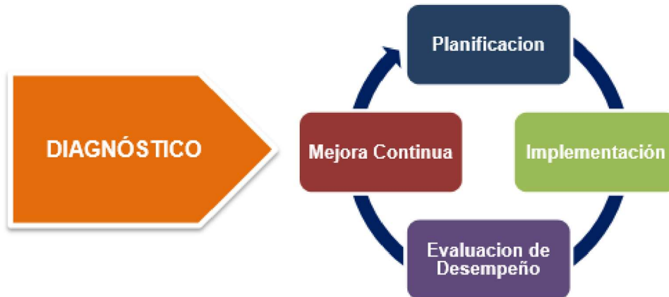
Figura 1: Ciclo de Operación Modelo de Seguridad y Privacidad de la Información