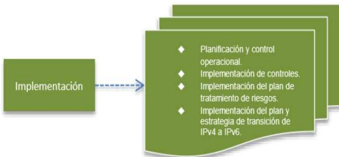
Figura 4: Fase de Implementación Modelo de Seguridad